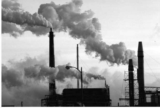
चित्र : फैक्ट्रियों से निकलते हुए धुएँ का दृश्य

Look at the picture given below and write the answers to the following questions :